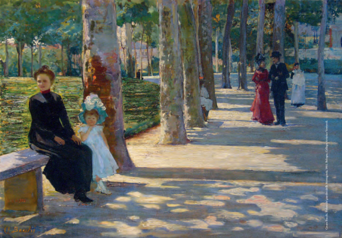
Corteo di piazza del giardino della Montagnola, 1911. Bologna, Collegio Artico Venturoli.